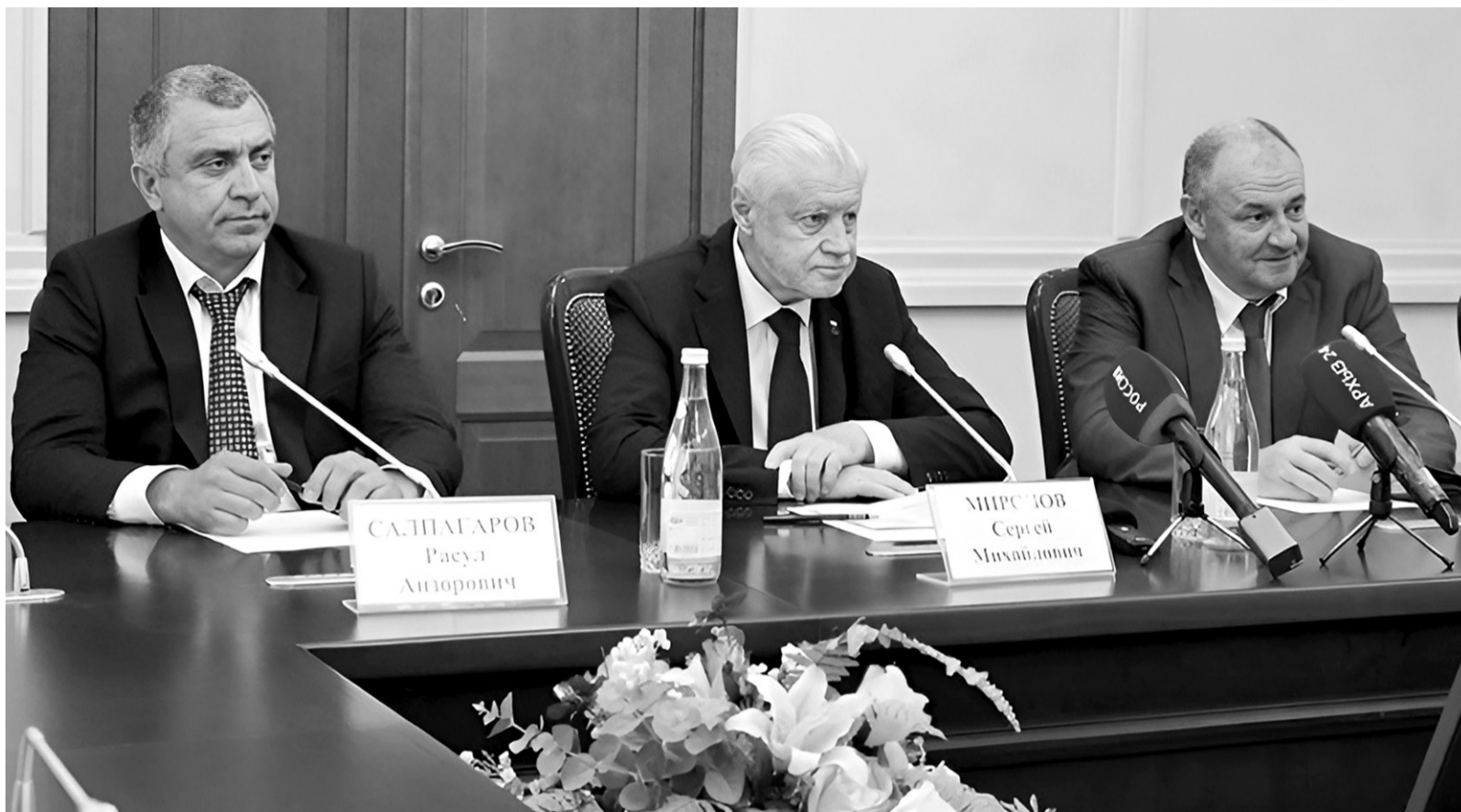
Встреча депутата Госдумы Сергея Миронова с парламентариями республики