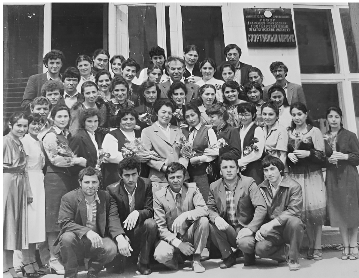
Выпускники физико-математического факультета КЧГПИ 1984 года

Еще больше интересного и нового на сайте denresp.ru