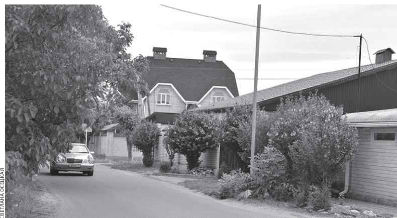
Сегодня улица Садовая утопает в зелени

Самая обычная, очень зеленая и тенистая, улица Садовая как будто и не торопится перешагнуть из прошлого века в современность. По сей день здесь можно встретить дома давно минувших дней, рядом с которыми кое-где возвышаются современные особнячки. Но хотя вид улицы по большей части все же патриархальный, автомобильное движение здесь весьма оживленное. Поэтому пешеходам стоит быть начеку, тем более, что тротуары на Садовой явление не повсеместное.